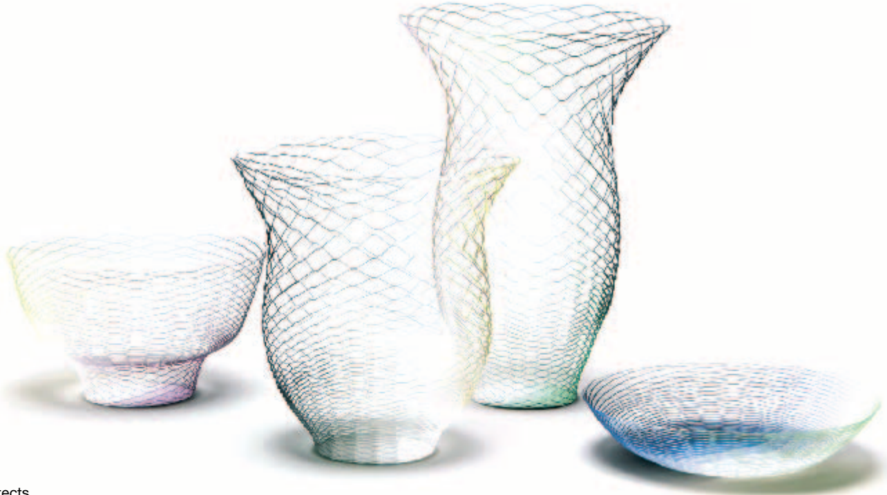
^ Airvase Torafu Architects Ligne Roset

Airvases are inconspicuous printed paper discs with a pattern cut into them. They can be stretched and shaped individually: long and thin or flat and bulbous. These decorative objects were presented in Milan in 2011 by Torafu Architects and since 2012, they have formed part of the Ligne Roset collection.