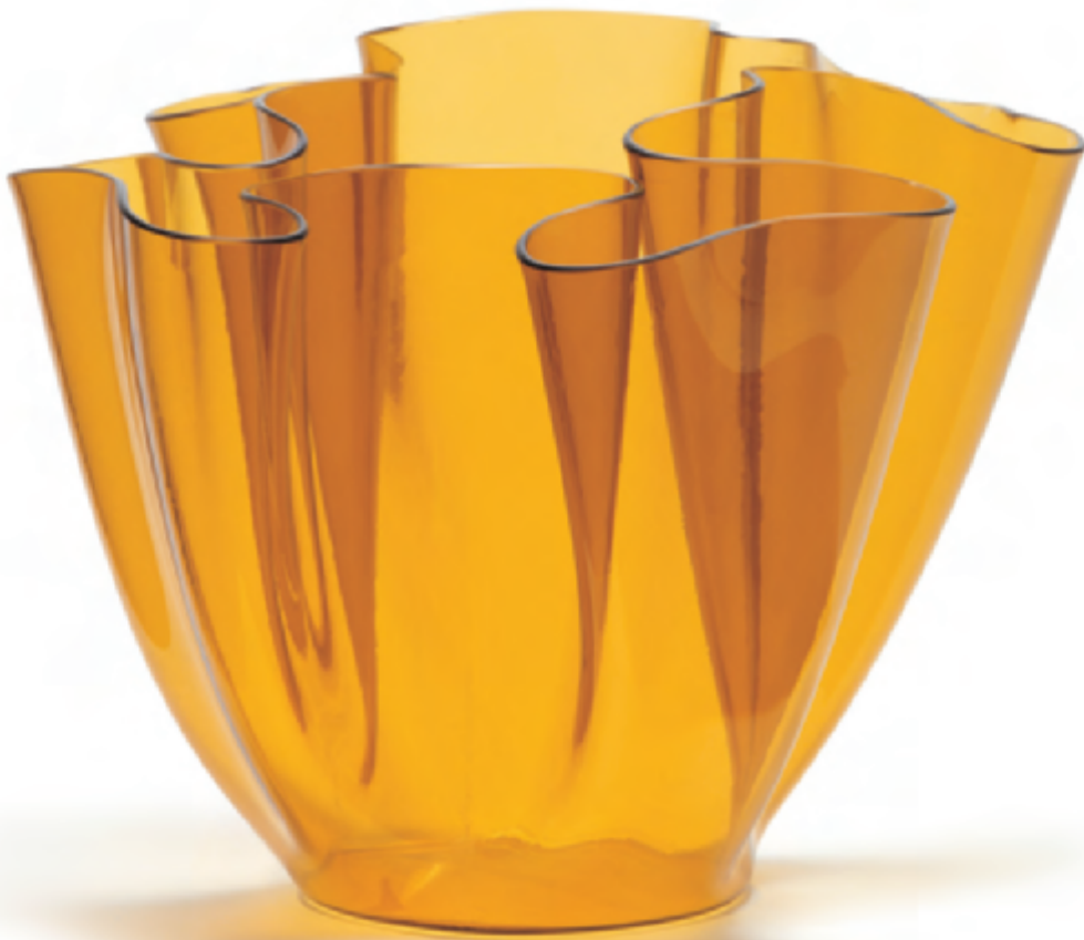
< Cartoccio No. 2029 Pietro Chiesa FontanaArte

FontanaArte was founded in 1932 by Gio Ponti as the artistic spin-off of the glass company Luigi Fontana. Together with Pietro Chiesa, Ponti took over the artistic management. In the very first year FontanaArte presented classics that exist today, such as the puristic glass table Fontana , and the unfolding wavy paper bag based on this vase.