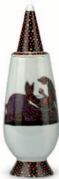
Twins Seven Seven