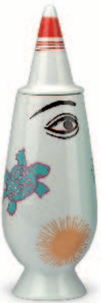
Ettore Sottsass jr.