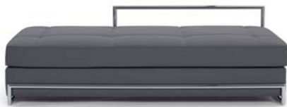
Divina grau grey

Estructura de tubos de acero cromado. Marco de haya acolchado con bandas de goma. Acolchado: poliuretano con espuma. Colchón separado con muelles Bonell, cubierta de fieltro de lana y poliuretano. Tapicería de tela o cuero. Detalles y colores ver lista de precios.