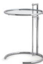
ADJUSTABLE TABLE E 1027 1927