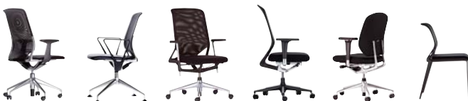
Meda Chair Meda Conference Chair Meda 2 MedaPro Spiro MedaSlim