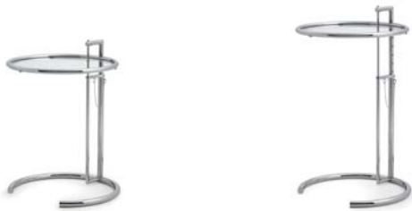
Kristallglas klar crystal glass clear

Mesa auxiliar de altura regulable. Estructura de tubos de acero cromado. Placa de cristal claro, gris parsol o de metal barnizado en negro. Detalles ver lista de precios.