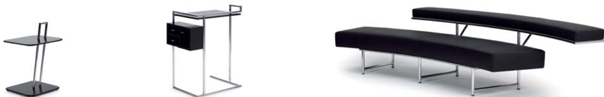
OCCASIONAL TABLE 1927